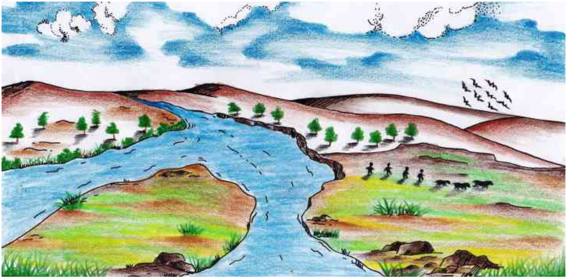
Laes Meto (Baikeno)